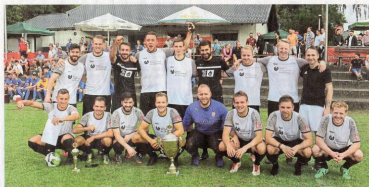
Bei der 13. Auflage in Heckholzhausen holte die SG Weinbachtal zum dritten Mal den Sparkassen-Cup.