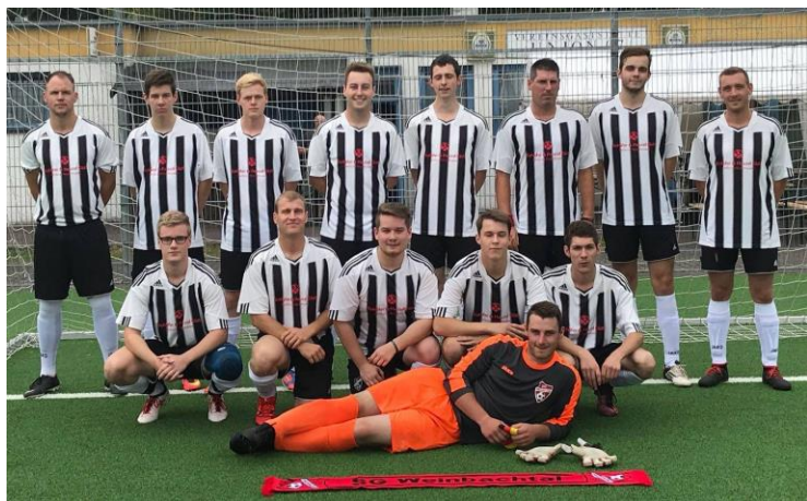
Die SG Weinbachtal III, die ihre Heimspiele in Blessenbach austrägt.